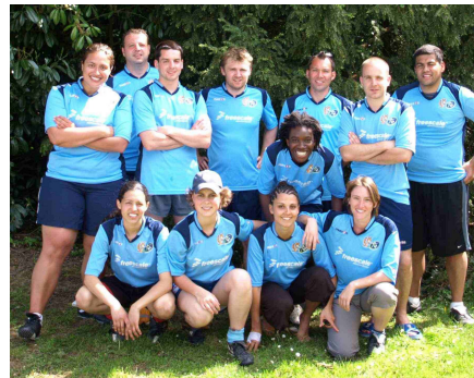
Les Don't Touch de TR91-TPAG

Le Touch In Paris est l'événement annuel phare de notre club.